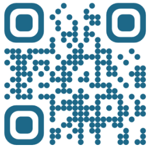
รายงานประจำปี 2568

เข้าไปใน Line แล้วเลือก add friend (เพิ่มเพื่อน) ▷ เลือก QR Code ▷ สแกน QR Code